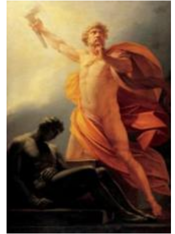
Resim 1: Prometheus insanoğluna ateşi veriyor. Heinrich Füger

Zeus, insan soyunun beceri ve güç kazanması ve o yolla tanrıların davranışlarına karşı gelmesi olasılığına sinirleniyordu. Sikyon 3 alanında hem insanların hem tanrıların huzurunda bir boğa kurban edildiğinde, geri dönülmez bir adım atılmış oldu. Şöyle ki, Prometheus etin paylaşılmasıyla görevlendirilmişti; fakat insanları düşünen tarafı baskın çıktı ve onları kayırmak istedi. Boğayı yüzüp de parçalara ayırdıktan sonra etleri iki çuvala böldü. Çuvalardan birine etleri koyup üzerini hiç de iştah çekmeyen sakatatla örttü, kemikleri tıkıştırdığı ötekinin ağzını lezzetli oluğu belli, yağlı bir parçayla kapladı. Tanrıların başı Zeus, bu iki payın eşitsizliğine şaşı ve aldatmacanın bilincinde olarak rahat rahat gülen Prometheus'u azarladı. Prometheus, Zeus'u iki çuvaldan