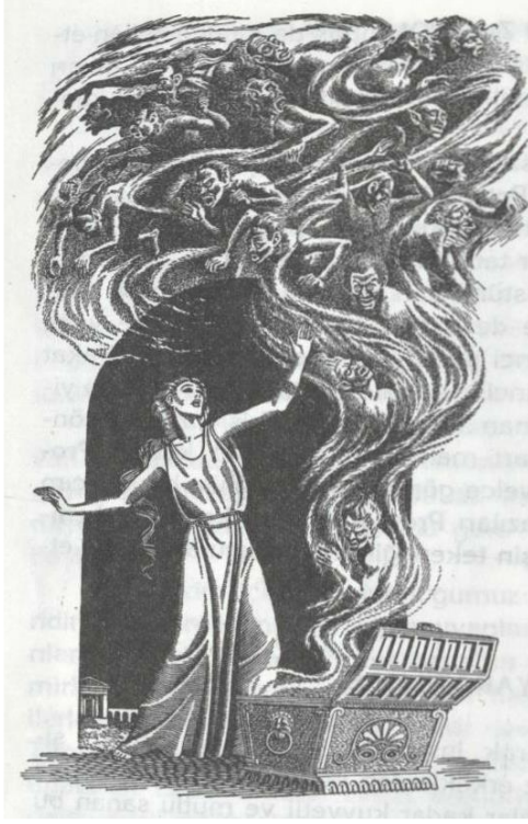
Resim 2: Pandora'nın kutuyu açması ve kutudan çıkan kötülükler.

Zeus, eline beyaz kemikler gelince öfkeden kudurarak çuvalı fırlatıp attı. Ayrıca, kendini tutamayıp gülmekte olan Prometheus'u cezalandırdı. Verdiği ceza, onun kayırdığı ölümlüleri