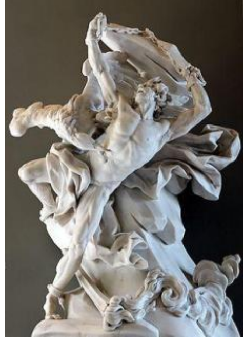
Resim 4: Prometheus ve kartal. Nicolas-Sébastien Adam, 1762 (Louvre)

Çocuk, çoktandan saf değil misin Benden bir şey öğreneceğini sanıyorsan? Dilediği kötülüğe, kurnazlığa başvurursun Zeus söyletmez bana istediğini Bu utanç zincirlerini çözmeden önce. Salsın üstüme kavuran alevini, Ak kanatlı karlara boğsun Zeus; Depremlerin yer altı gümbürtüleriyle Afallatsın, allak bullak etsin dünyayı Hiçbir şey söyletmez bana adını Onu tahtından atacak olanın? Dilediği kötülüğe, kurnazlığa başvurursun Zeus söyletmez bana istediğini Bu utanç zincirlerini çözmeden önce. Salsın üstüme kavuran alevini, Ak kanatlı karlara boğsun Zeus; Depremlerin yer altı gümbürtüleriyle Afallatsın, allak bullak etsin dünyayı Hiçbir şey söyletmez bana adını Onu tahtından atacak olanın!