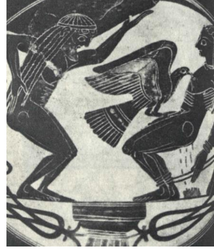
Resim 5: Prometheus'un Cezalandırılması ve Atlas. Etrüsk Sanatları Müzesi'ndeki konik bir kupadan ayrıntı, Vatikan.

Ah keşke yerin altına atsaydı beni Ölülerin ülkesi Hades'ten 2 de aşağı Tartaros'un 3 inilmez derinliklerine. Orada bağlasaydı beni Çözülmez bağlarla. Hiçbir tanrı, hiçbir varlık Görmeseydi beni, Görüp de sevinmeseydi, Oysa şimdi, Zavallı bir oyuncağıym rüzgârların. Sevine sevine görecek düşmanlarım Çektiğim işkenceyi.