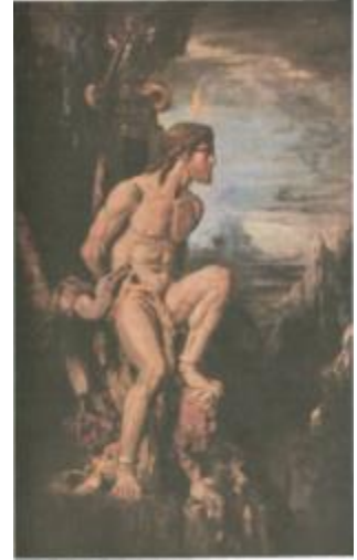
Resim 3: Zincire vurulmuş Prometheus ve onun karaciğerini kemiren kartal.

Ah gelin de zincirlere vurulmuş bir tanrı görün! Zeus'un düşmanını görün, İnsanları sevdi diye Zeus'un sarayındaki büyük tanrılarının Düşman kesildiği tanrıyı görün!