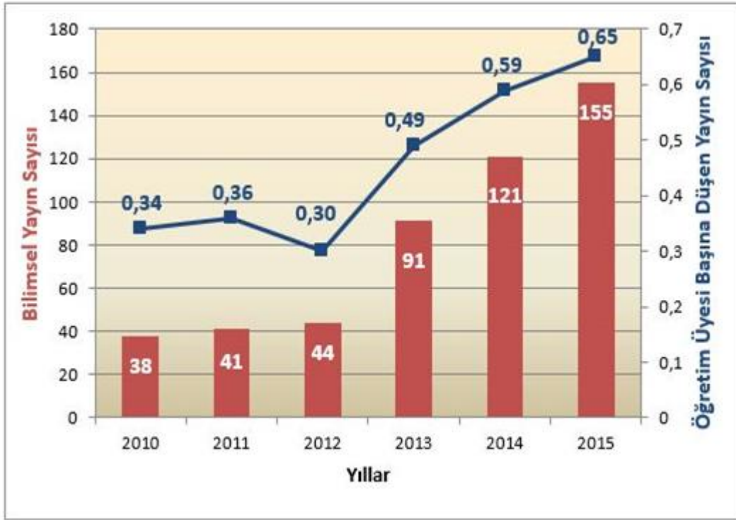
Şekil 1: Üniversitemiz Web of Science Verileri

sürdürmektedir. Ulusal/uluslararası hakemli dergilerde Üniversitemiz adresli yayın yapan öğretim elemanlarının yılda bir kez yurt dışındaki bilimsel kongre ve sempozyumlara katılımları desteklenmektedir. Ulusal/uluslararası hakemli dergilerdeki yayınlarına ek olarak SSCI-AHCI vb. gibi uluslararası indekslerce taranan dergilerde yayın yapan Üniversitemiz öğretim elemanlarının yurt dışındaki bilimsel kongre ve sempozyumlara katılımları ikinci kez desteklenmektedir. Üniversitemiz 2015 Yılı Akademik Faaliyet Raporu ile akademik başarı kriterlerinden olan SSCI, SCI, AHCI gibi indeksli dergilerde yayınlanan makale sayısı ve öğretim üyesi başına düşen yayın sayısı gibi veriler izlenmektedir. Bu çerçevede her geçen yıl Üniversitemiz akademik düzeyi yükselen bir başarı grafiğine sahiptir. bk. Şekil 1